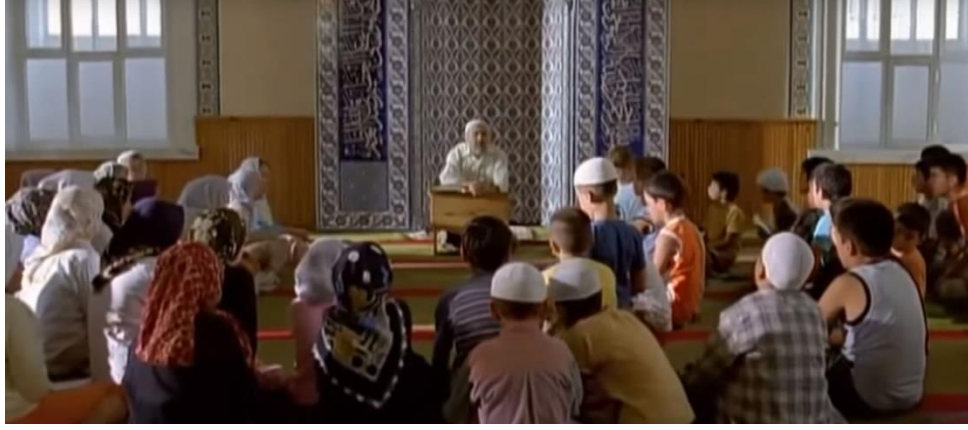
Görsel 5. Camii İmamının çocuklara ders verdiği sahne