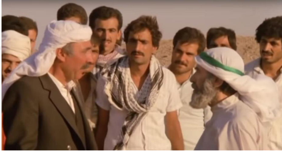
Görsel 1. Ağa ile Şih'in tartışma sahnesi

olacaktır. Ankara'dan köye gelen siyasi temsilciler, yapılacak olan seçimde köylünün kendileri için oy kullanmalarını Ağa'dan isterler. Ağa bunun üzerine köylüye para dağıtır. Fakat Şih'in kendi desteklediği partiye oy vermeleri karşılığında cennetten arsa tapusu vermesiyle herkes oyunu Şih'in partisine atar. Ağa'nın partisine ise sadece bir oy çıkar. Ağa, babasını evinde işe başlayan marabalardan birinin bacısı olan Kiraz ile istemese de evlendirmek zorunda kalır. Çünkü Kiraz'a Ağa'da âşık olmuştur. Düğün gecesi Abdo Ağa kalp krizi geçirerek ölür. Düğün gecesi, köylü ağanın buğdaylarını çalarak satar ve İstanbul'a kaçarlar. Bu durum karşısında iyice çıkmaza giren ağa, köyü satıp İstanbul'a gitmeye karar verir. Ankara'dan gelen bir uyanıkta köye kurulacak barajı önceden haber almıştır. Ağa'ya gelerek bütün köyü ucuza alır. İstanbul'a giden ağa, önce bir market açar ama işletemez ve batar. Ardından seyyar satıcılığa başlar ama yine başaramaz. Son parasını da hırsızlara kaptıran ağa en iyi yaptığı işi yaparak, sokaklarda çiğ köfte satmaya başlar.