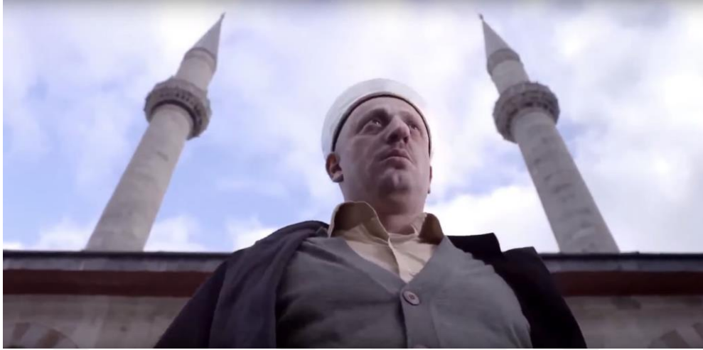
Görsel 6. Selman hocanın katili aradığı sahne